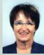
Ruth Gyga Homöopathie für den Hausgebrauch 14.00–17.00

Siehe auch Seminar vom Dienstag Seminarkosten CHF 50.- (Anmeldung siehe Seite 15)